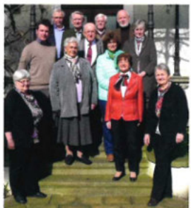
Arbeitsgemeinschaft Vertriebene der Oldenburgischen Landschaft 2015

Unter dem Dach der Oldenburgischen Landschaft erarbeitet die Arbeitsgemeinschaft Vertriebene wissenschaftliche Publikationen und organisiert Ausstellungen und Veranstaltungen zur Geschichte und Gegenwart der deutschen Vertriebenen im Oldenburger Land.