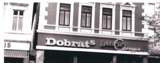
Adolf Dobrat KG, Achternstraße

Rufen Sie uns an, um sich zu informieren.