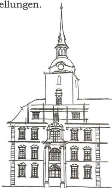
Eva Simmat: Oldenburger Schloss, aus: Landessparkasse zu Oldenburg 1786–1961, Oldenburg 1961

Die Ausstellung umfasst 15 Rollbanner. Auf einem wird der Anlass der Ausstellung erläutert. Ein anderes stellt eine Reihe von Personen bzw. Unternehmen kurz mit Lebensdaten und Beschreibung vor. Dazwischen stehen Rollbanner mit Einzeldarstellungen.