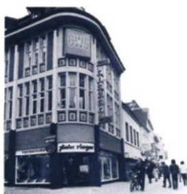
Farben Rieger, Baumgartenstraße Ecke Achternstraße